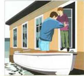
ЭВАКУИРУЙТЕСЬ ИЗ ОПАСНЫХ РАЙОНОВ. В ПЕРВУЮ ОЧЕРЕДЬ ИЗ ЗОНЫ ЗАТОПЛЕНИЯ НЕОБХОДИМО ВЫВЕЗТИ ДЕТЕЙ