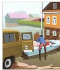
ПРИГОТОВЬТЕ ИМЕЮЩИЕСЯ ПЛАВСРЕДСТВА