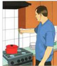
ВЫКЛЮЧИТЕ ГАЗ, ЭЛЕКТРИЧЕСТВО, НАГРЕВАТЕЛЬНЫЕ ПРИБОРЫ