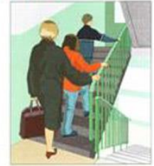
ПОДНИМИТЕСЬ НА ВЕРХНИЕ ЭТАЖИ. ПЕРЕНОСИТЕ ПРОДОВОЛЬСТВИЕ, ЦЕННЫЕ ВЕЩИ, ОДЕЖДУ, ОБУВЬ