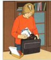
ВОЗЬМИТЕ ДОКУМЕНТЫ, ДЕНЬГИ, ЦЕННОСТИ САМЫЕ НЕОБХОДИМЫЕ ВЕЩИ