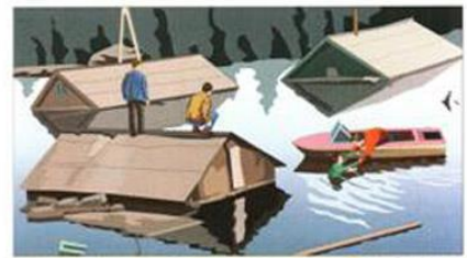
ПО ВОЗМОЖНОСТИ ОКАЖИТЕ СРОЧНУЮ ПОМОЩЬ ЛЮДЯМ, ОЧУТИВШИМСЯ В ВОДЕ

Учредители: Администрация муниципального района Безенчукский, Собрание представителей муниципального района Безенчукский